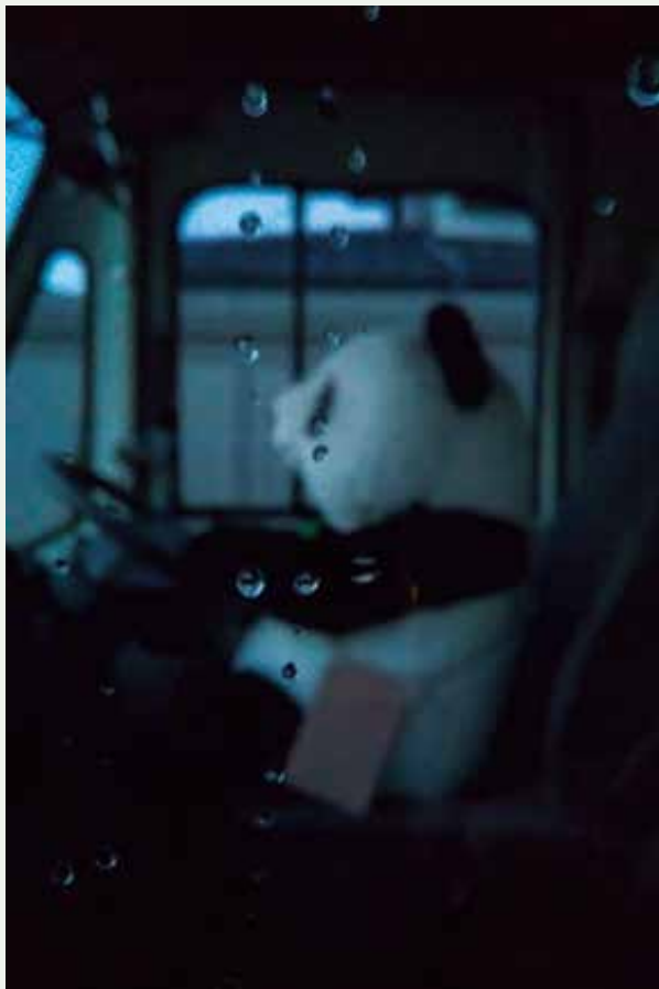
sekaino namida wo tsurete